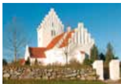
NR. ASMINDRUP KIRKE