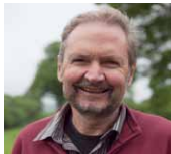
FOLMER BLUME LEIDE WWW.LEIDE.DK

Hos Matthæus hedder det: "Når du vil bede, så gå ind i dit lønkammer..." Er der noget bedre lønkammer end naturens? Der, hvor Gud sørger for uventet opladning og nyt livsmod til os? Måske er det dér,