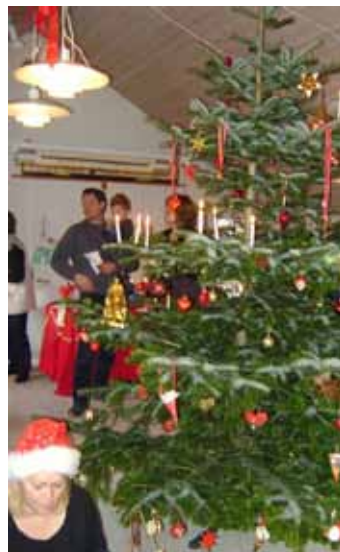
DAGPLEJENS JULETRÆSFEST I PRÆSTEGÅRDEN 2011 MED BESØG AF JULEMANDEN OG DANS OM JULETRÆET.