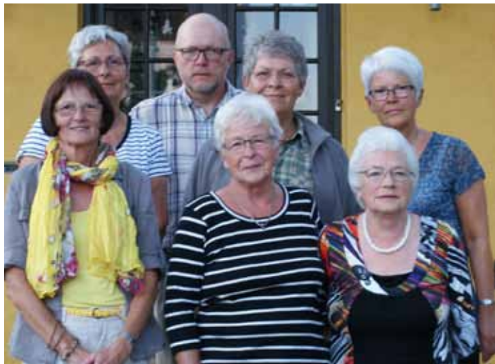
DET AFGÅENDE MENIGHEDSRÅD I VIG

Gennem årene har der været adskillige store opgaver, der skulle løses. I den seneste periode kan af større ting bl. a. nævnes: installering af nyt varmeanlæg, klargøring