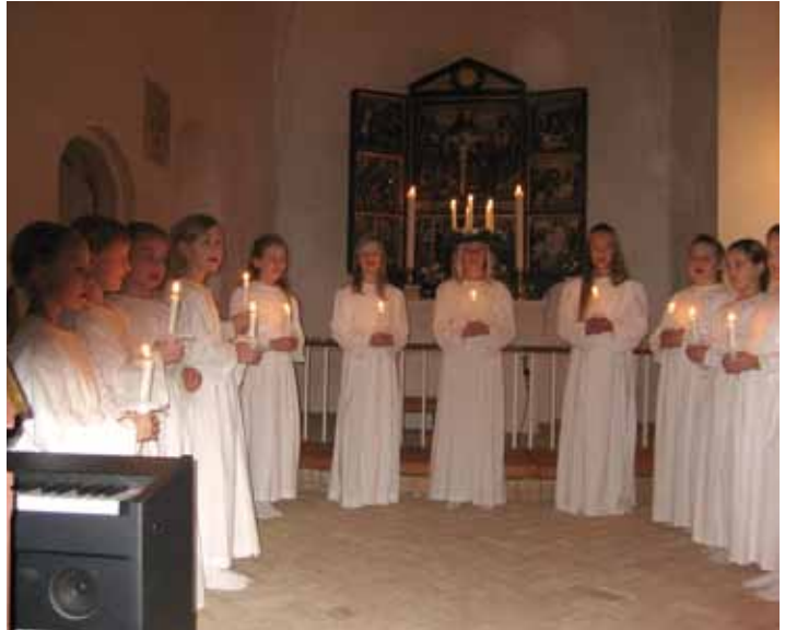
Luciaoptog - Børnekoret 2011