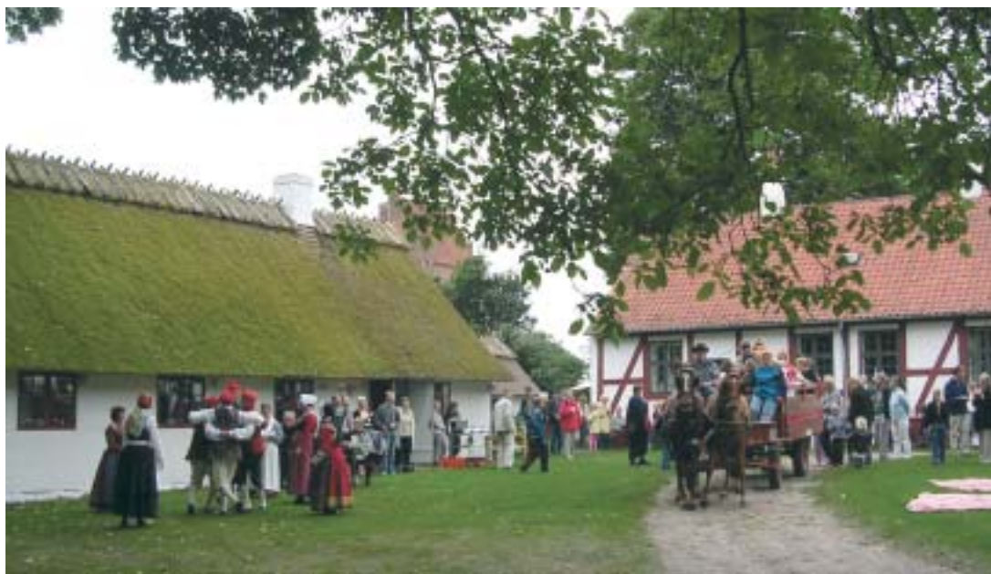
DET STEMNINGSFULDE BILLEDE ER FRA EN TIDLIGERE HØSTGUDSTJENESTE

Alle er velkomne til denne spændende eftermiddag.