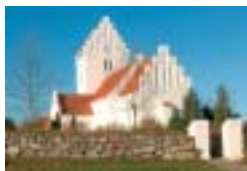
NR. ASMINDRUP KIRKE