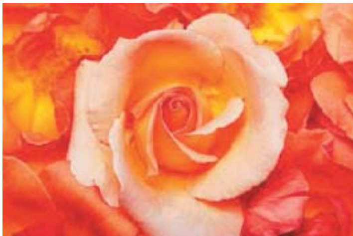
EN ROSE... ER EN ROSE... ER EN ROSE...

Den, der er blevet til gen- nem Helligånden, er ånd.