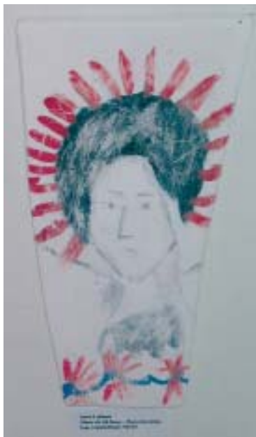
TO AF DE MANGE FINE TEGNINGER I VÅBENHUSET